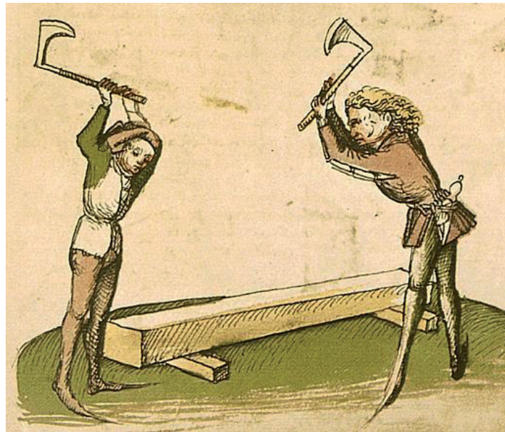
Zimmerleute bei der Arbeit.