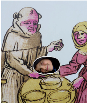
Möchtest Du auch einmal in der Richental-Chronik mitspielen?

Gelegenheit dazu. Am Stand der Konzilstadt Konstanz kannst Du Dir einen eigenen Spielplan ganz nach Deinen Ideen gestalten.