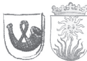
Welche Farben hatten die Wappen? Male sie doch einfach aus

– wie Johann gedacht hatte –, sondern weil dort der neue Papst gewählt werden sollte!