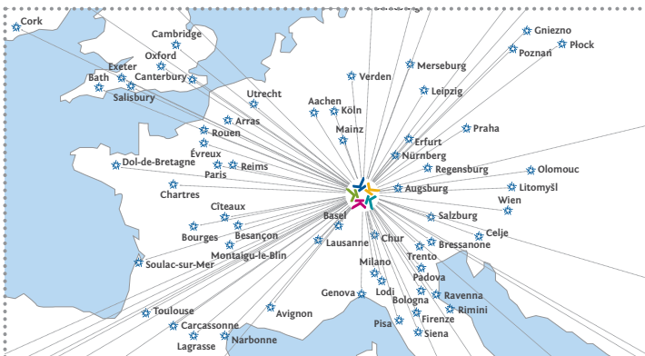
Herkunft der Teilnehmer des Konstanzer Konzils

mittel, die auf St. Stephan angeboten wurden aus Konstanz: Die ganze Region half bei der Versorgung der Konzilsteilnehmer mit, Fische wurden zusätzlich vom Gardasee angeliefert, Weine aus Italien und dem Elsass. Wer auf dem Markt mit seinen Sprachkenntnissen nicht weiterkam, hatte im Münster beim Beichten mehr Glück: Die kirchlichen Vertreter ließen im Münster zwölf mit Schildern gekennzeichnete Beichtstühle aufrichten, in denen man in verschiedenen Sprachen Vergebung erlangen konnte.