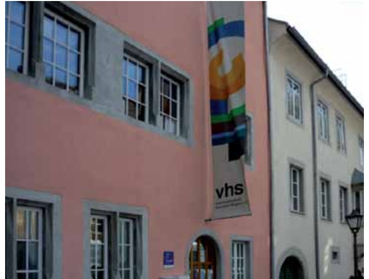
Die Volkshochschule in Konstanz