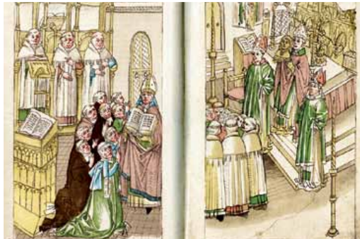
Heiligsprechung von Birgitta von Schweden 1415

Ziel der aus allen Himmelsrichtungen angereisten Delegationen war die Beendigung der Kirchenspaltung, aber daneben brachten die meisten der Teil-