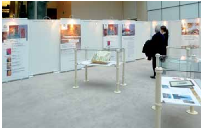
Ausstellung der Konzilstadt in Brüssel

Andreas Gross: Europa und die Demokratie brauchen einander: Wie zusammenkommen kann, was zusammengehört! 19.30 – 21.00 Uhr, vhs Konstanz