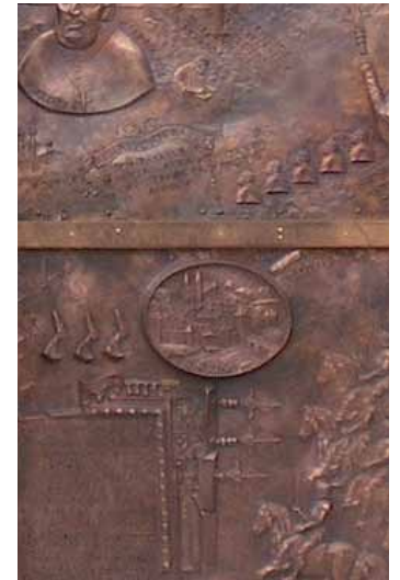
Ausschnitt der Domtür in Telšiai, im Oval Darstellung der Stadtsilhouette des mittelalterlichen Konstanz'

So feiert in den nächsten Jahren nicht nur das Konstanzer Konzil ein Jubiläum, sondern auch das Bistum Samogitien. In Litauen koordiniert die Stadt Telšiai die Jubiläumsfeierlichkeiten. Dort ziert seit 2009 ein Relief der Stadtsilhouette des mittelalterlichen Konstanz die Domtür.