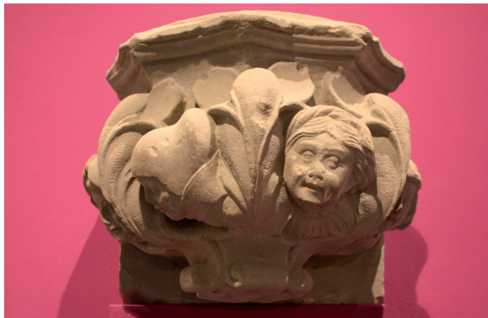
Frauenköpfe in verschiedenen Lebensstadien

Das Rosgartenmuseum, das staatliche Hochbau- und Universitätsbauamt Konstanz und die Münsterbauhütte inszenieren in der Ausstellung „Ewige Steine“ auch einige Stücke aus dem Konstanzer Münster, die sich dort schon zur Konzilszeit befanden. So wird eine Konsole mit Frauenköpfen in verschiedenen Lebensstadien gezeigt. Die Abbildungen zeigen das spätmittelalterliche Verständnis einer Frau, die sich von einem jungen Mädchen mit offenen Haaren zu einer Verlobten mit Flechtkranz, einer verheirateten Frau (unter der Haube) und schließlich zu einer Alten mit wissendem Lächeln verwandelt. Die Ausstellung ist eine ungewöhnliche Verbindung von stillen Steinen und lauten Farben, eine Erinnerung an die spätmittelalterliche Stadt, ihren architektonischen Gestaltungs-