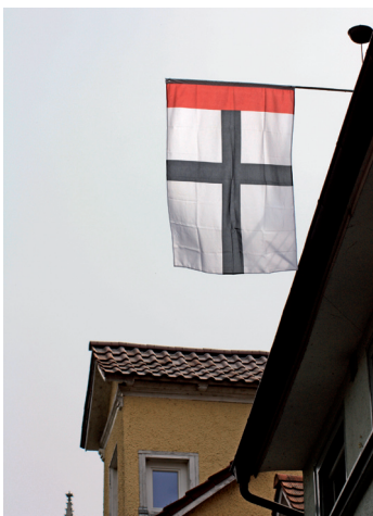
Konstanzer Fahne in der Niederburg

zu haben – hierauf beruft sich heute noch eine Vielzahl der Konstanzer Fanfarenzüge. Auf Schritt und Tritt begegnet man in Konstanz dem Konzil. Braune Tafeln an Hauswänden, farbenprächtige Malereien, Denkmäler und Gebäude erinnern