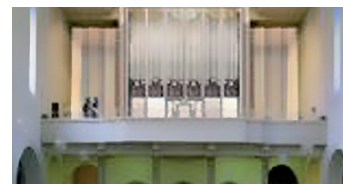
Entwurf der neuen Orgel in St. Gebhard

im Südkurier am Fischmarkt ausliegen. +49 (0)7531 9423701