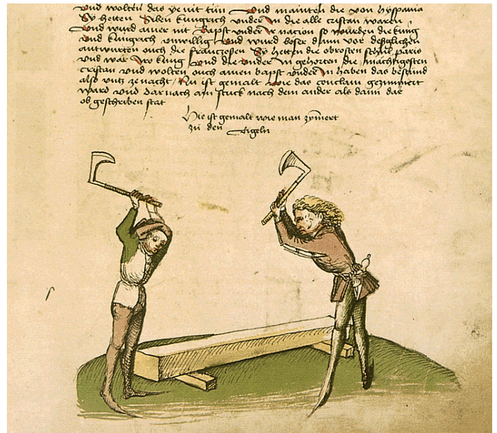
Handwerker in der Richental-Chronik