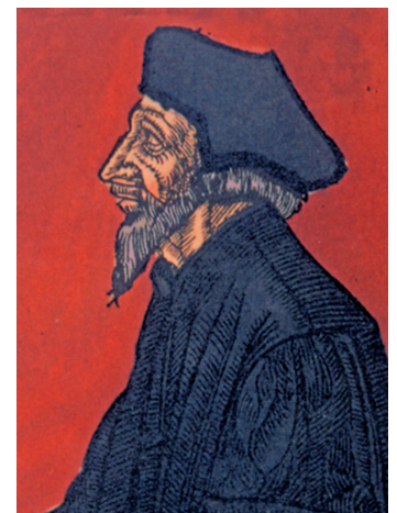
Der Reformator Jan Hus

im Hus-Museum in Konstanz. Seine Reise können Sie auch im Internet unter "www.hussitenstaedte.net" verfolgen. Treten Sie in die Fußstapfen des Jan Hus und erleben Sie eine interaktive Entdeckungsreise. Durch Klick auf die unterschiedlichen Stationen seiner