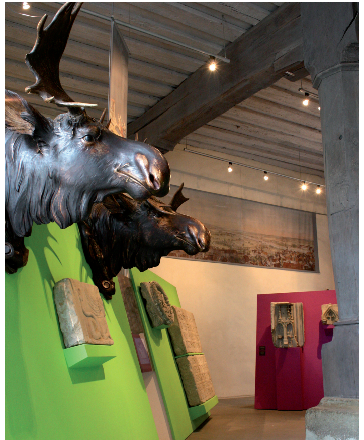
Impressionen aus der Ausstellung

willen und die zeitlose Bildhauerkunst der Gotik und der Renaissance.