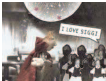
Die VIPs des Konzils

► Der Film: Ulrich Richental als Promi-Reporter, König Sigismund als Superstar und Kardinäle, die rappen – diese Arbeit zeigt das Konzil aus der Sicht eines Boulevard-Magazins und spießt deren Mechanismen hübsch auf. Moderne Musik (Snap „I've got the power“), moderne Sprache (VIP-Magazin = Vögel, Intrigen, Party) treffen auf das altherwürdige Konzil. Respektlos und bisweilen herrlich komisch, manchmal auch etwas überdreht. Realisiert als Film mit Puppen- und Pappfiguren als lockere Form der Verfremdung. (lün)