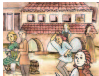
Der Alltag im Mittelalter