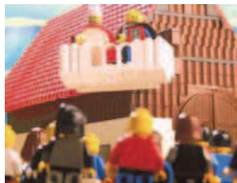
Konzil im Legoformat